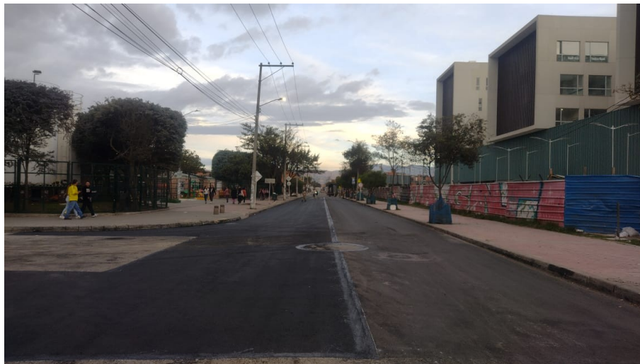
Foto terminado segmento vial pk 500147.