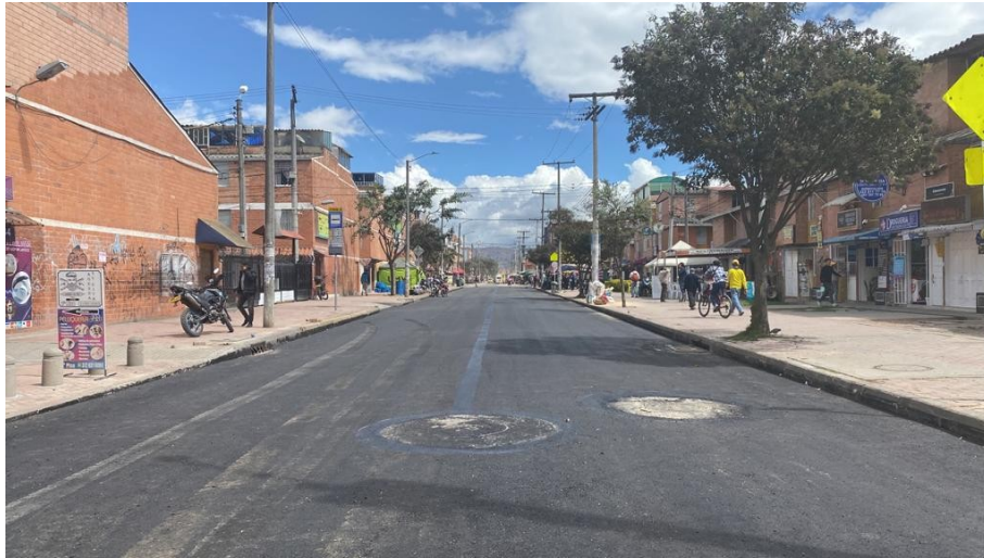
Foto terminado segmento vial pk 2503978.