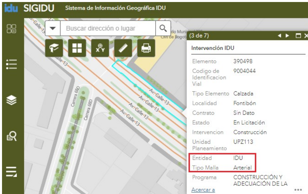
Figura 1 Fuente: SIGIDU (13-diciembre-2023)

(...)” (sic) la Unidad Administrativa Especial de Rehabilitación y Mantenimiento Vial (UAERMV) por medio de la Subdirección de Planificación y de Conservación (SPC) revisó el tramo correspondiente a su requerimiento, de acuerdo con las indicaciones dadas en su petición, en el Sistema de Información Geográfica del Instituto de Desarrollo Urbano (SIGIDU) y consultó el Sistema de Información Geográfica Misional y de Apoyo (SIGMA) observando lo siguiente: