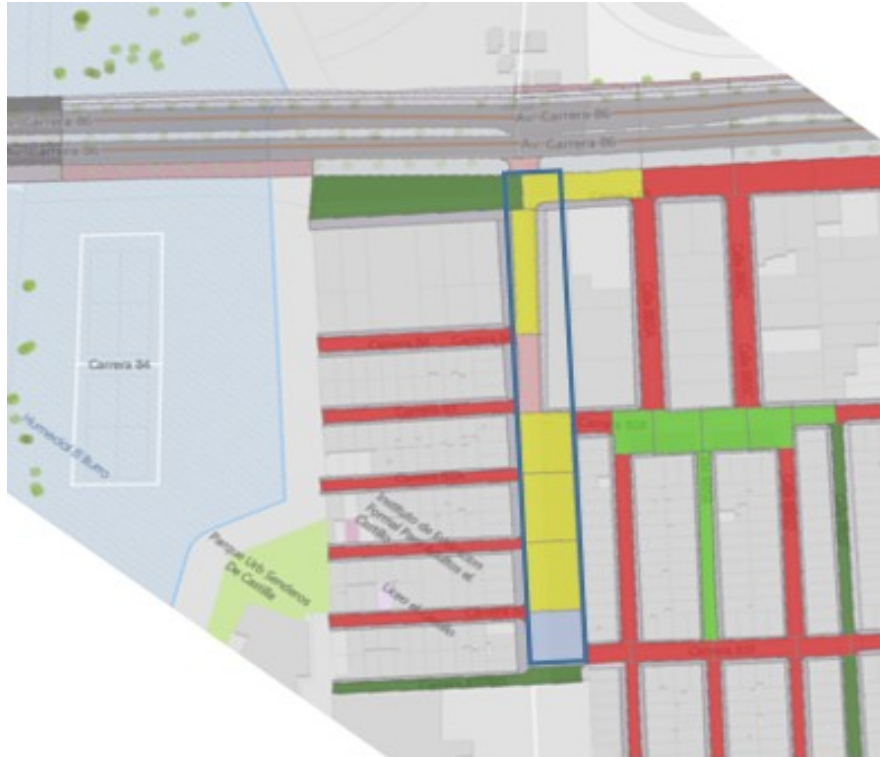
Ilustración 1. Calle 8 entre Carrera 84 y Carrera 85