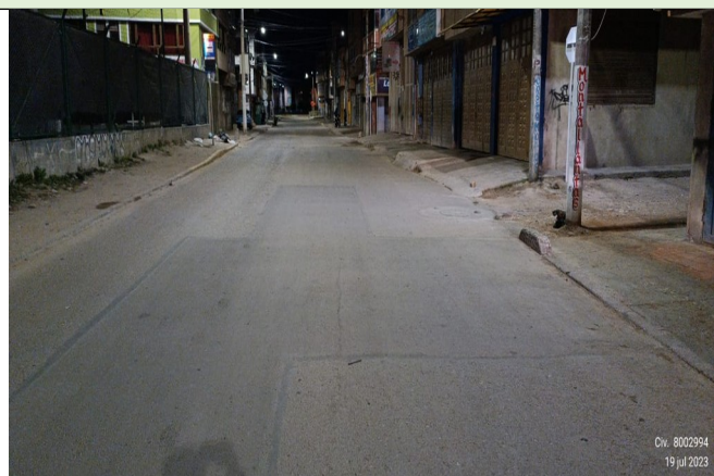
CIV 8002994 PK 155424 - KR 89C ENTRE CL 42 F S y CL 42 F BIS S

Por otra parte, teniendo en cuenta la solicitud de la peticionaria con relación al corredor vial del asunto, la Unidad de Mantenimiento Vial le aclara que, los segmentos viales con la observación “Reservado - Alcaldía Local de Kennedy”, están a cargo de la Alcaldía Local de Kennedy.