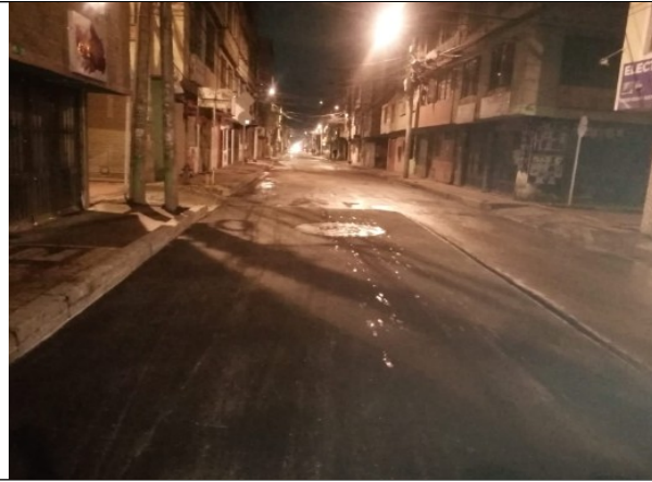
CL 143B ENTRE KR 145A Y KR 145B CIV 11001785 - PK 175908

Por otra parte, el segmento con Código de Identificación Vial CIV 11001777 – PK 176042, ubicado en la Carrera 145B entre la Calle 143B y la Calle 144 se encuentra reservado por el Fondo de Desarrollo Local de Suba. La Unidad Administrativa Especial de Rehabilitación y Mantenimiento Vial – UAERMV, envía copia de esta comunicación a la Alcaldía Local de Suba, para que emita respuesta de fondo a la pretensión realizada.