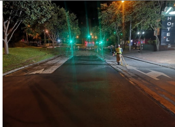
AK 7 ENTRE CL 127 Y CL 127A CIV 1008134 - PK 91030534 SENTIDO N-S

Acorde con lo anterior, la Unidad Administrativa Especial de Rehabilitación y Mantenimiento Vial – UAERMV aclara que, el 27 de enero de 2023 no se realizaron intervenciones por parte de la Entidad, en el tramo vial de su interés.