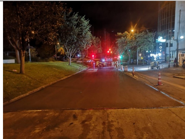
AK 7 ENTRE CL 127 Y CL 127A CIV 1008134 - PK 91030534 SENTIDO N-S