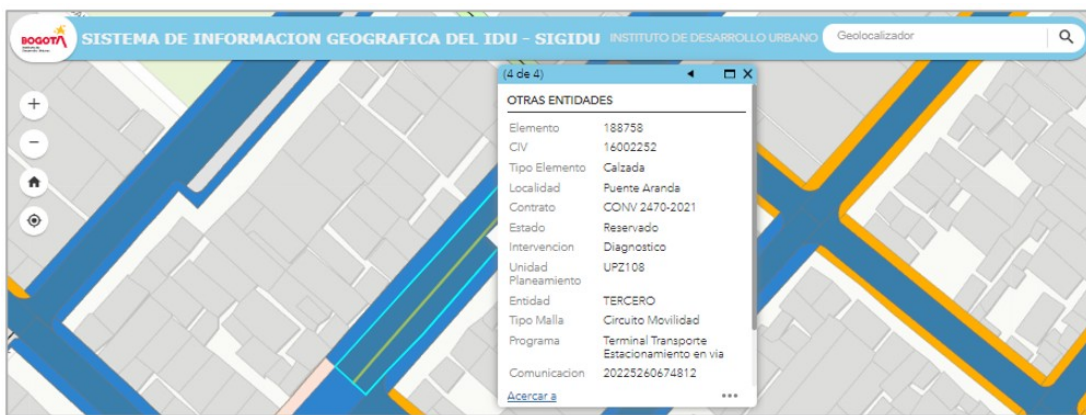
FIGURA 1. Fuente: SIGIDU (2-junio-2023)

De acuerdo con la verificación efectuada y con base en los datos registrados en el SIGIDU y el SIGMA, no es posible para la UAERMV intervenir la dirección de su requerimiento en este momento, teniendo en cuenta que el tramo correspondiente se encuentra reservado por un tercero ante el Instituto de Desarrollo Urbano, (Figura 1) por lo que dicha Entidad puede ampliar la información al respecto.