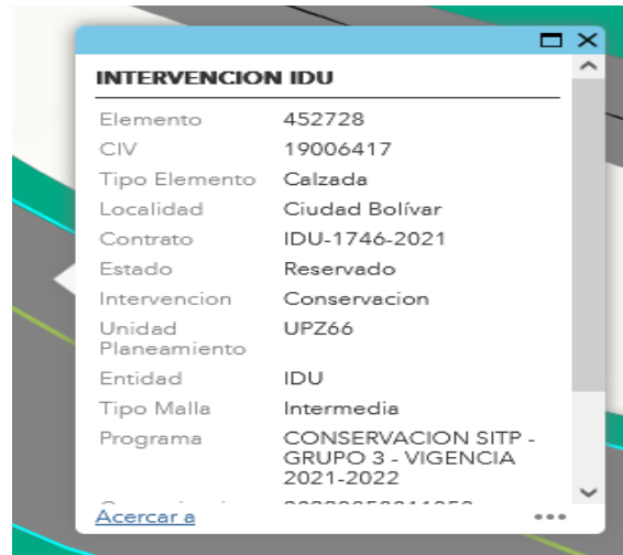
FIGURA 1 - SIGIDU (14-junio- 2023)

Esta Subdirección informa que de acuerdo con la verificación efectuada y con base en los datos registrados en el SIGIDU y el SIGMA, el tramo correspondiente a la dirección de su solicitud se encuentra reservado por parte del Instituto de Desarrollo Urbano - IDU. (Figura 1).