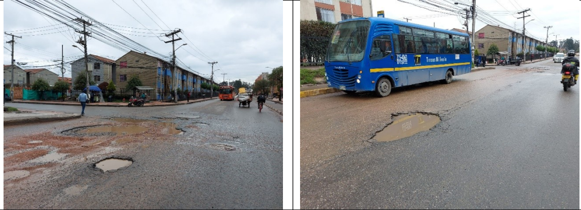
CL 26 S ENTRE KR 95 Y KR 98 CIV 8014134 PK 9101403

Finalmente, le manifestamos nuestra voluntad de servicio en pro de mejorar la calidad de vida de todos los bogotanos, y expresamos nuestra disposición para continuar trabajando por Bogotá.