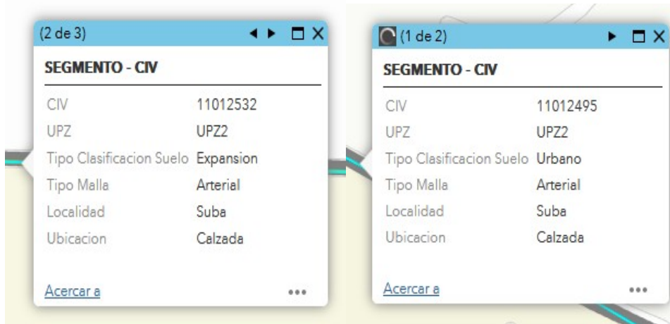
Figura 6

Esta Subdirección informa que de acuerdo con la verificación efectuada en el SIGIDU y en el SIGMA, los tramos anteriormente relacionados al cual hace referencia en su comunicado, corresponde a la Avenida Arrayanes que hace parte de la Malla Vial Arterial de la Ciudad.