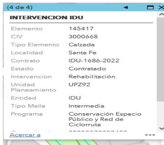
FIGURA 1 - SIGIDU (06-marzo-2023)