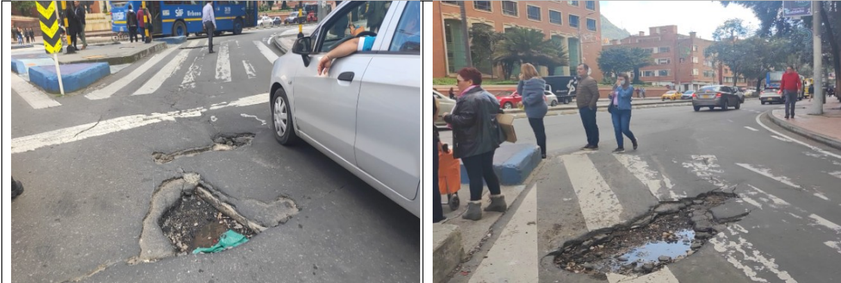
CONECTANTE ENTRE AC 72 Y AK 7 PK 24119804 – CIV 2001162

De acuerdo con lo anterior, La Unidad de Mantenimiento Vial le informa que se va a revisar la viabilidad de realizar las acciones de movilidad puntuales de los tramos en mención, como Apoyo interinstitucional por medio del Procedimiento IMVI-PR-003, teniendo en cuenta que, se encuentran en el programa de “CORREDOR VERDE”.