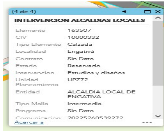
FIGURA 1 - SIGIDU (13-enero 2023)

Esta Subdirección informa que de acuerdo con la verificación efectuada y con base en los datos registrados en el SIGIDU y el SIGMA, el tramo correspondiente a la dirección de su solicitud se encuentra reservado por parte del Fondo de Desarrollo Local de Engativá. (Figura 1).