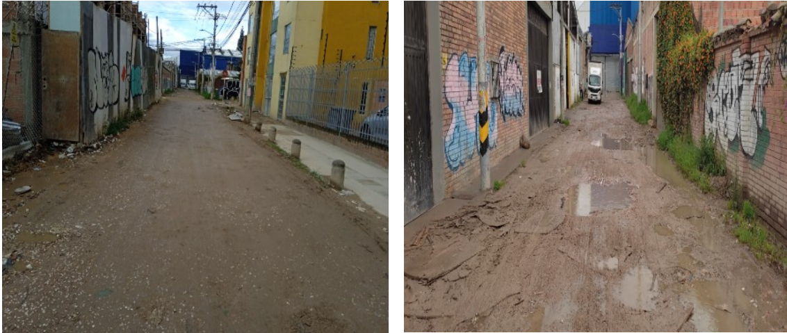
Figura 1 – Transversal 112 C entre Calle 64 D y Diagonal 66

Complementado la respuesta 20223871873911 del Instituto de Desarrollo Urbano – IDU y de acuerdo con la información recopilada por la Entidad, el tramo correspondiente a la vía de su solicitud es de uso vehicular, que se encuentra con superficie en material afirmado y requiere ser intervenido mediante actividades de Construcción (Figura 1).