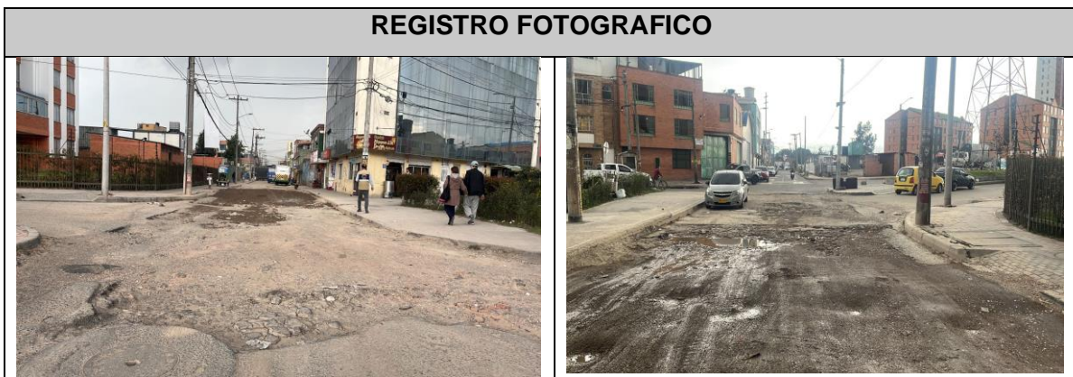
Ilustración 1. CIV 8011117 PK 149057

En atención a su solicitud, la Unidad Administrativa Especial de Rehabilitación y Mantenimiento Vial- UAERMV, le informa que el segmento vial relacionado en el requerimiento, identificado con el CIV 8011117 PK 149057, localizados en la carrera 72G entre transversal 72FBIS sur y diagonal 43 sur, se encuentra priorizado en las intervenciones del convenio 534 de 2021 suscrito entre el FDLK y UAERMV, el cual tiene por objeto: “aunar esfuerzos técnicos, administrativos, financieros y ambientales entre La Unidad Administrativa Especial De Rehabilitación Y Mantenimiento Vial - UAERMV y El Fondo de Desarrollo Local de Kennedy – FDLK para realizar el diagnóstico, diseño, rehabilitación y mantenimiento de la malla vial local e intermedia, cicloinfraestructura y el espacio público asociado, de la localidad DE Kennedy, en el marco de la generación del empleo de emergencia y la reactivación económica de Bogotá D.C.”, para realizar actividades rehabilitación (cambio de estructura de pavimento), de acuerdo a programación del convenio, se tiene proyectado intervenir en primer trimestre del año 2023 , adjunto registro fotográfico de la visita de verificación.