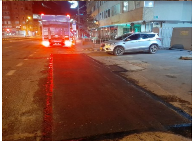
AK 7 ENTRE CL 66 Y CL 67 PK 524750 - CIV 2002204