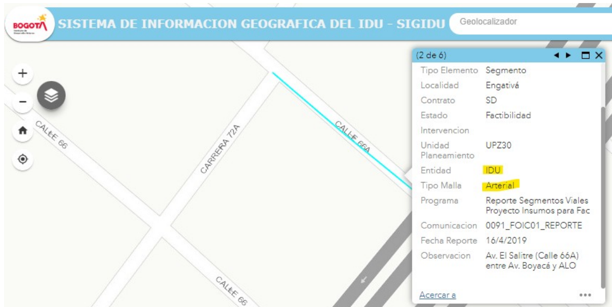
Figura 1 Fuente: SIGIDU (31-octubre-2022)

En atención a la comunicación del asunto, relacionada con “(...) solicita el mantenimiento de la vía ubicada en la Calle 66A con Avenida Boyacá de la Localidad de Engativá (...)” (sic) la Unidad Administrativa Especial de Rehabilitación y Mantenimiento Vial (UAERMV) por medio de la Subdirección de Mejoramiento de la Malla Vial Local (SMVL) revisó el tramo correspondiente a su requerimiento, de acuerdo con las indicaciones dadas en su petición, en el Sistema de Información Geográfico del Instituto de Desarrollo Urbano (SIGIDU) y consultó el Sistema de Información Geográfica Misional y de Apoyo (SIGMA) observando lo siguiente: