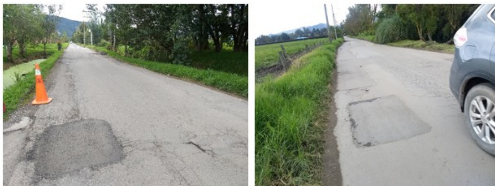
Figura 2 – CL 209 entre AK 45 y CLUB ARRAYANES

Adicionalmente, y con base en la información recopilada por la Entidad y la visita de inspección visual técnica realizada, los tramos que conforman la Avenida Arrayanes (Calle 209) son de uso vehicular, con tipo de superficie mixta, en pavimento flexible y material de fresado, los cuales requieren actividades de mantenimiento periódico y de Construcción (Figura 2)