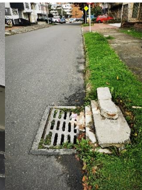
Esquina nor oriental

La impresión de este documento se considera Copia No Controlada La versión vigente se encuentra en la intranet SISGESTION de la UAERMV