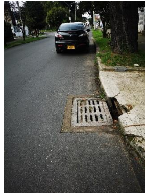
Esquina sur occidental