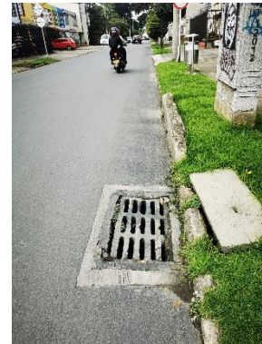
Esquina nor oriental