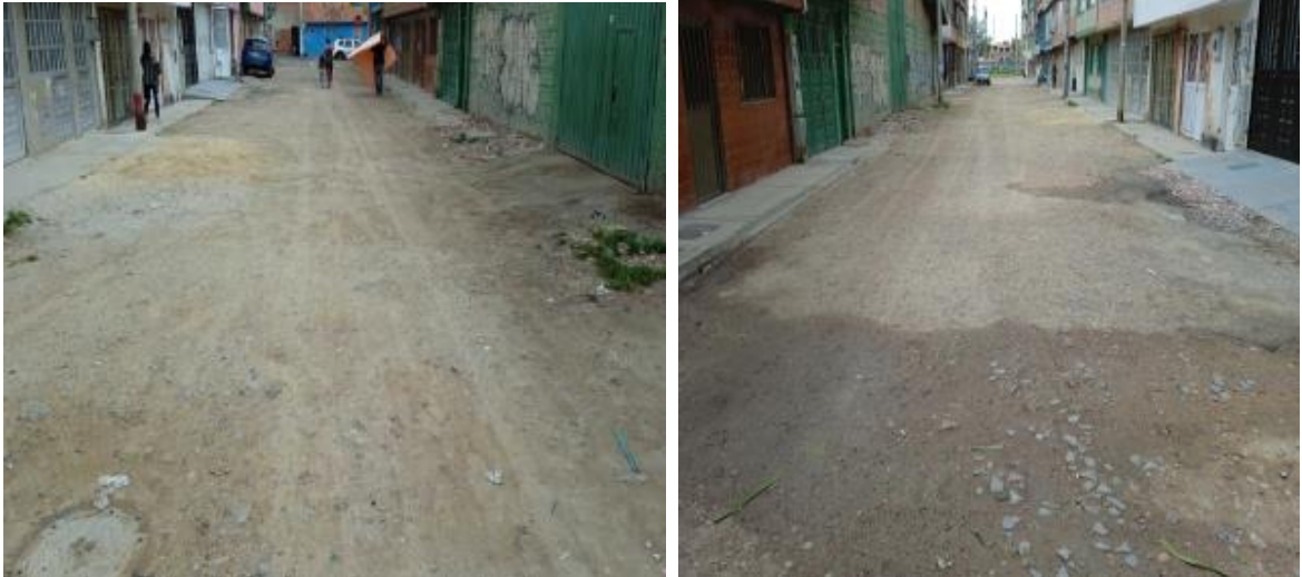
Figura 1 – Calle 54F Sur entre Carrera 88 I y Av. El Tintal

Teniendo en cuenta la misionalidad y los programas actuales de la UAERMV, los cuales están dirigidos a la Rehabilitación y el Mantenimiento de la malla vial existente de la ciudad y no a la construcción de vías, no es posible para la Entidad intervenir el tramo señalado , de acuerdo con lo instaurado en el artículo 109 del Acuerdo 257 de 2006: “Naturaleza jurídica, objeto y funciones básicas de la Unidad Administrativa Especial de Rehabilitación y Mantenimiento Vial.” Modificado por el Artículo 95 del Acuerdo 761 de 2020, donde se establece entre otras, la siguiente función: