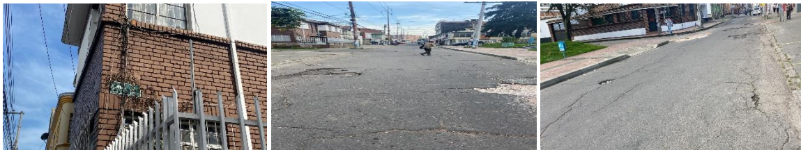
CIV 12002673 Carrera 16 calle 65 A Calzada y andenes