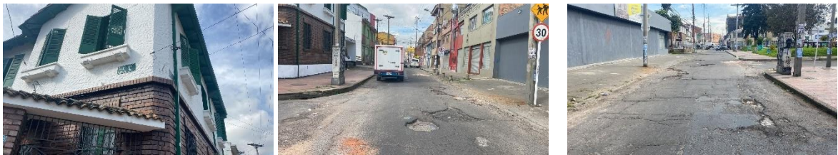
CIV 12002673 Carrera 16 calle 65 Calzada y andenes