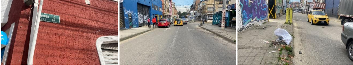
CIV 12002718 Carrera 15 calle 64 A calzada y andenes