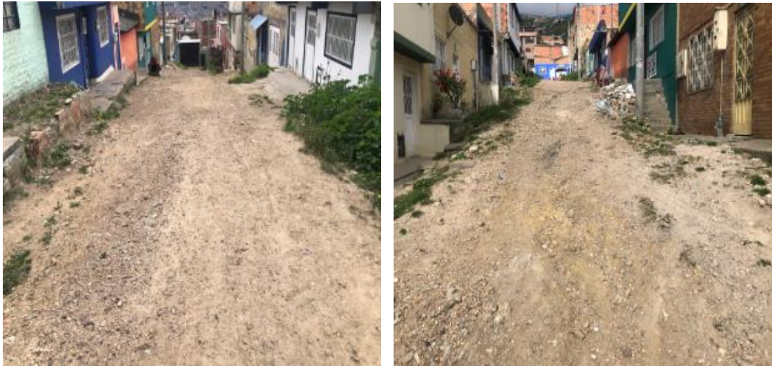
Figura 1 – Diagonal 71F Sur entre Transversal 18J hasta Transversal 18 I Bis Sur

De acuerdo con la información recopilada por la Entidad, el tramo correspondiente a la vía de su solicitud es de uso vehicular, que se encuentra con superficie en material afirmado y requiere ser intervenido mediante actividades de Construcción (Figura 1).