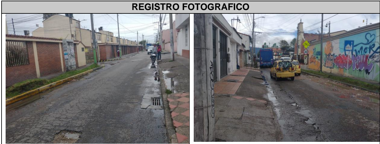
Ilustración 1. Registro fotográfico CIV 8005572 (Mantenimiento)