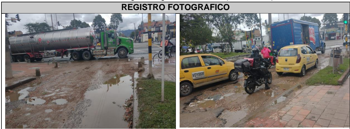
Ilustración 1. Registro fotográfico CIV 8013547 (Rehabilitación)