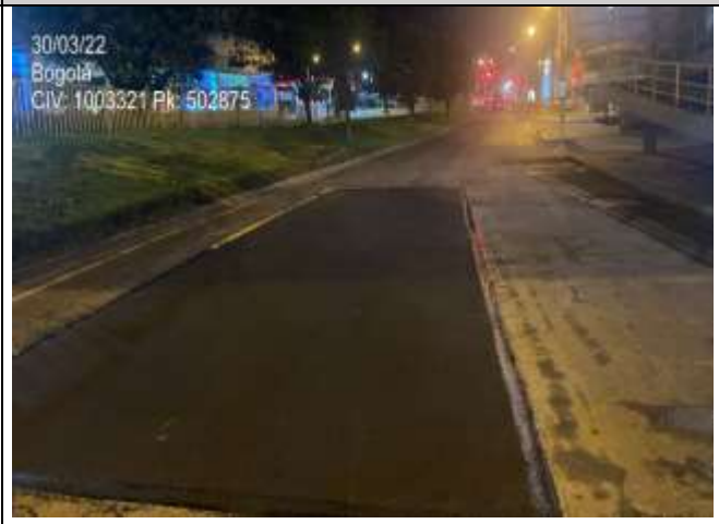
AK 7 entre CL 155 Y CL 153A PK: 502875