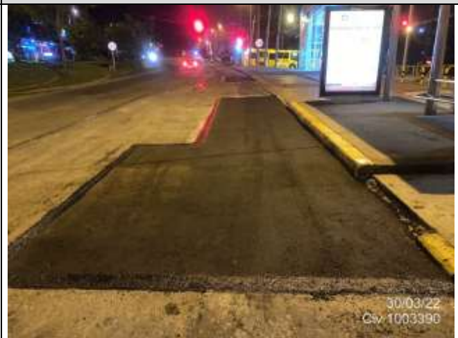
AK 7 entre CL 153A Y CL 153 PK: 502870