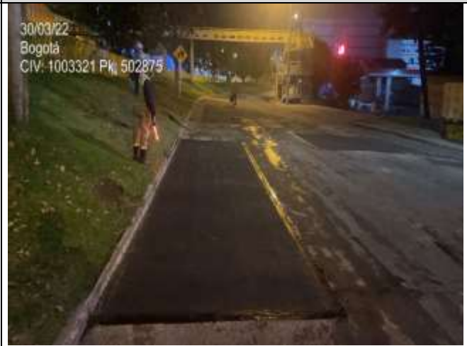
AK 7 entre CL 155 Y CL 153A PK: 502875