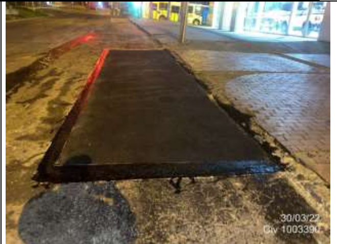
AK 7 entre CL 153A Y CL 153 PK: 502870