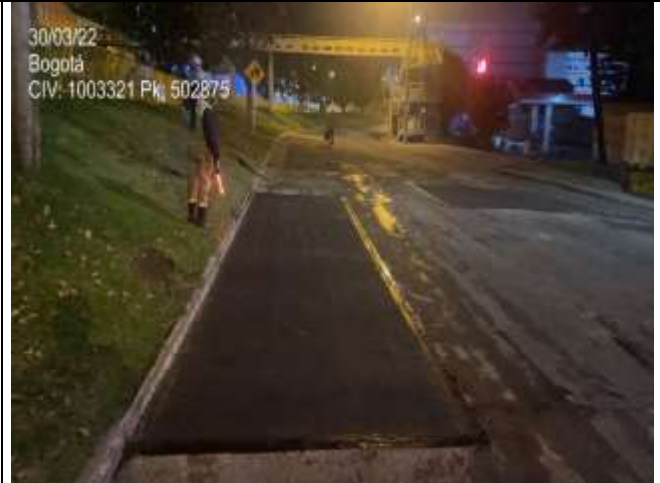
AK 7 entre CL 155 Y CL 153A PK: 502875