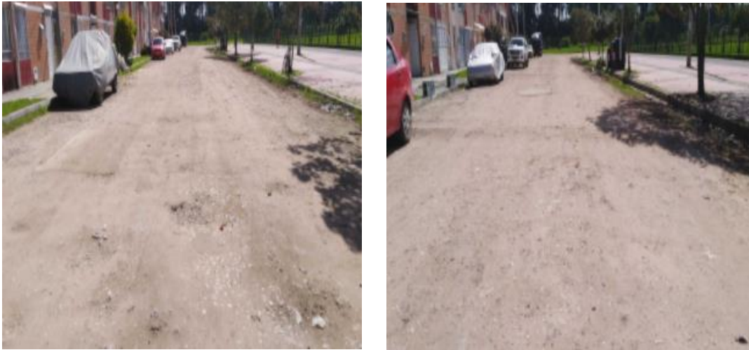
Figura 1 – Diagonal 147 entre Transversal 141B Bis y Calle 146

Teniendo en cuenta la misionalidad y los programas actuales de la UAERMV, los cuales están dirigidos a la Rehabilitación y el Mantenimiento de la malla vial existente de la ciudad y no a la construcción de vías, no es posible para la Entidad intervenir el tramo señalado , de acuerdo con lo instaurado en el artículo 109 del Acuerdo 257 de 2006: “Naturaleza jurídica, objeto y funciones básicas de la Unidad Administrativa Especial de Rehabilitación y Mantenimiento Vial.” Modificado por el Artículo 95 del Acuerdo 761 de 2020, donde se establece entre otras, la siguiente función: