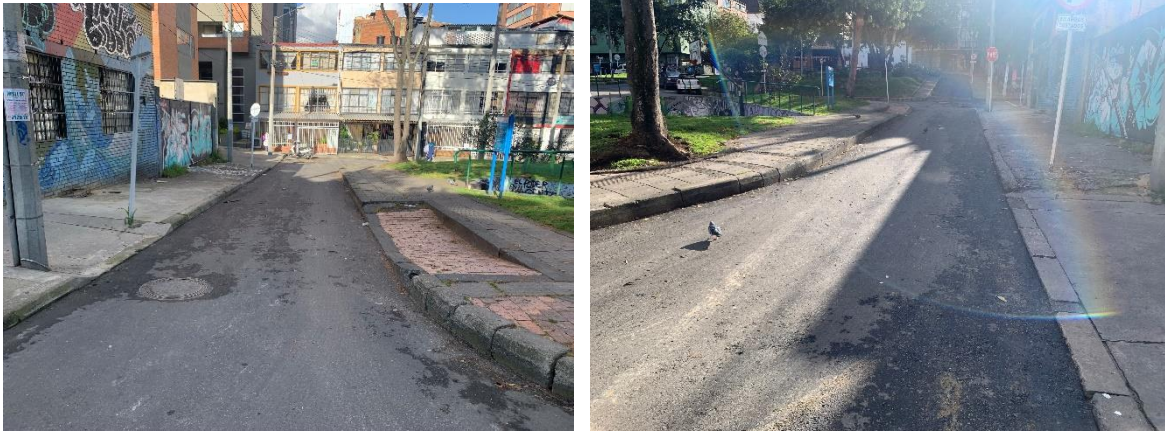
Figura 1 – Calle 41A entre Carrera 8 y Carrera 8A

Con lo anterior damos respuesta a su petición y le manifestamos nuestra disposición para continuar trabajando por Bogotá”